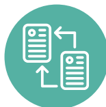
Sistemas de Intercambio