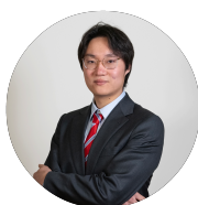
León Sun Soporte Técnico Estándares GS1